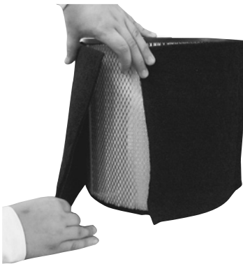
Remettre un préfiltre tel qu'indiqué