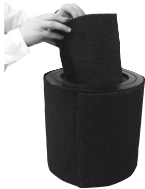
Placer le filtre COV à l'intérieur du filtre HEPA